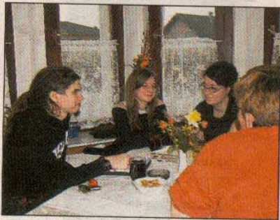
Erfreulich: Jugend im Literaturcafé.