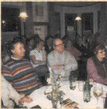
Beliebter Literaturtreff in Koblach.

Das Literaturcafé ist immer am 7. eines Monats geöffnet und lädt Literaturinteressierte und Literaturschaffende zu Gesprächen ein.