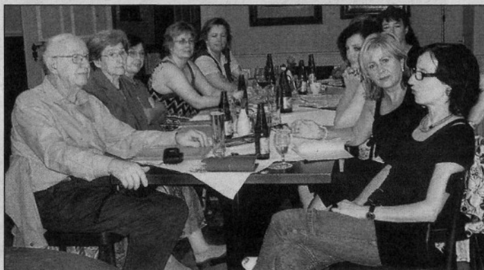
Erfahrungen austauschen auf der Lesebühne.